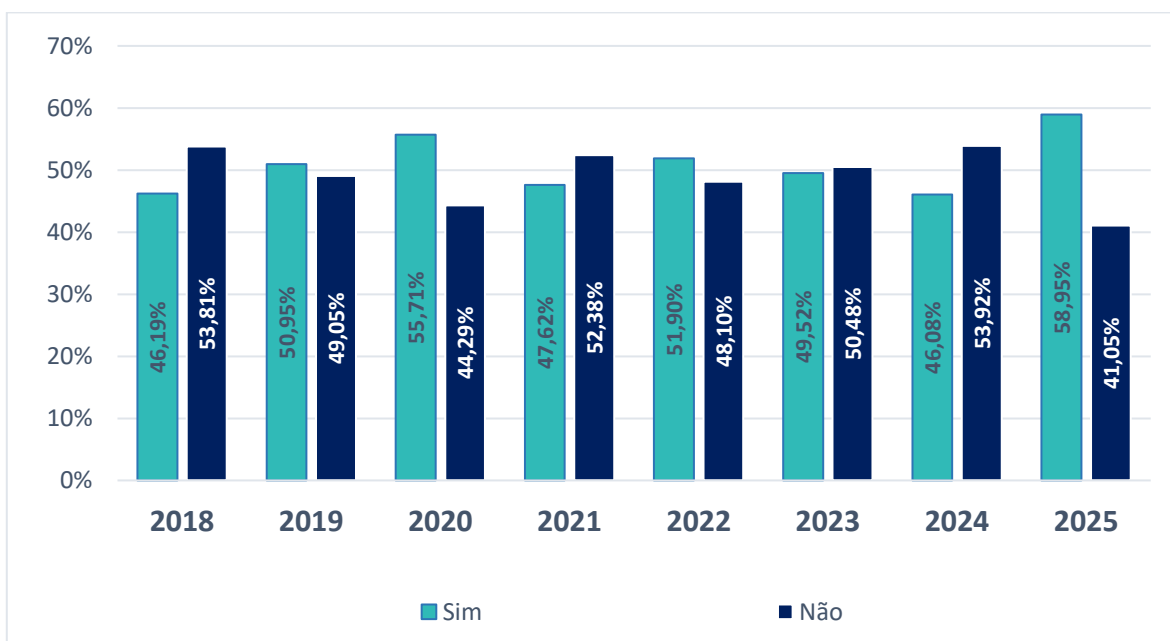
Gráfico 1: Consumidores que recebem 13º salário ou gratificação similar, Belo Horizonte, outubro/2025

Cerca de 59% dos consumidores receberam ou receberão o 13º salário em 2025, maior nível desde 2018 (Gráfico 1). Em 2024, essa proporção foi de 46%, aumento de 13 pontos percentuais.